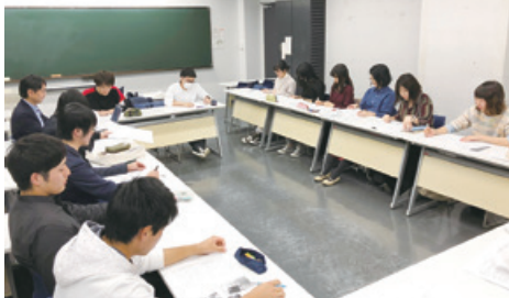
机を口の字型にして発表を行う