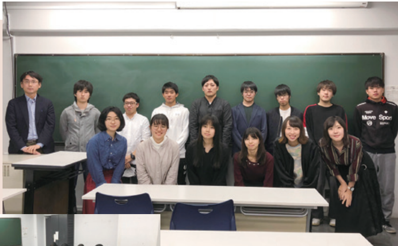
石橋先生とゼミ生たち

私たちのゼミでは、西洋近代、およそ16世紀から19世紀までを研究しています。ゼミ生一人ひとりが興味を持った主題を選び、その対象は貿易から音楽までとさまざまです。授業は発表が主で、2019年度は年3回の発表を予定しています。先生からアドバイスをいただいたり、学生同士で質問をし合ったりしながら、3年次におけるゼミ論、そして大学4年間の集大成である卒論に向けて、日々努力を重ねています。