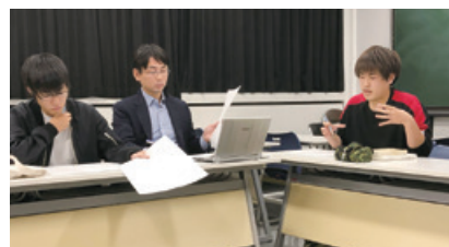
質疑応答での様子

このようにして研究を進めていき、学期末には1年間の成果をゼミ論の執筆という形でまとめ上げます。また、多くの場合はゼミ論の内容をそのまま卒論に引き継いでいくため、このゼミで学んだことが大学4年間すべての集